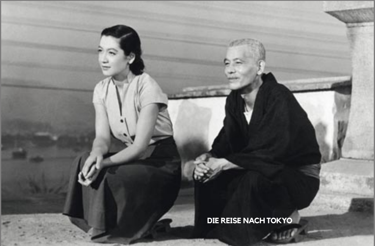
DIE REISE NACH TOKYO